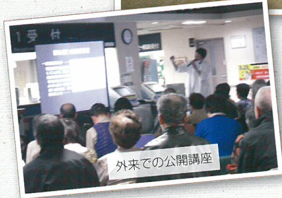
外来での公開講座